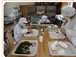
袋詰めの様子 (風班 昆布加)