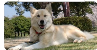
セラピー犬 クーちゃん