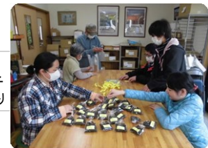
おやつこんぶ リボン付けの様子 (花班 シール貼り)