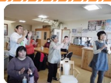
カラオケの様子 歌って踊って 盛り上がります

4月:研修旅行 5月:野の花総会、運動会 9月:バーベキュー大会 10月:ソフトボール大会 11月:ソフトバレー大会 12月:野の花風館まつり 1月:初詣、ぜんざい会 ※前後する事があります。 毎月:全体会、そよ風クラブ(当事者活動)、誕生会(カラオケ) その他:学習会、野の花だよりの発行、お花見、ソフトボールやソフトバレーの練習があります。