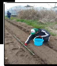
ニンニクの植え作業