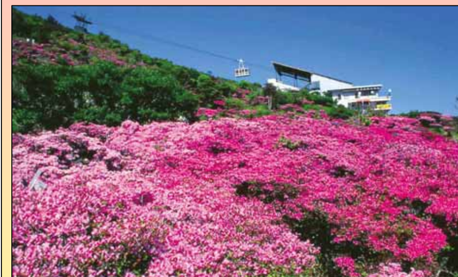
市の花:ミヤマキリシマ