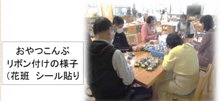
おやつこんぶ リボン付けの様子 (花班 シール貼り)