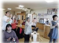
カラオケの様子 歌って踊って 盛り上がります

毎月: 全体会、そよ風クラブ(当事者活動)、誕生会(カラオケ) その他: 学習会、野の花だよりの発行、お花見、ソフトボールやソフトバレーの練習があります。