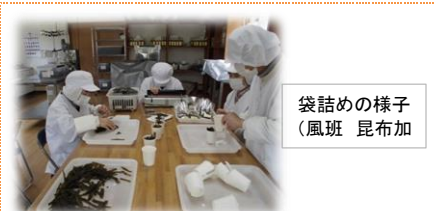
袋詰めの様子 (風班 昆布加)