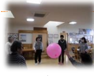
ソフトボール大会