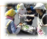
野の花風館まつり