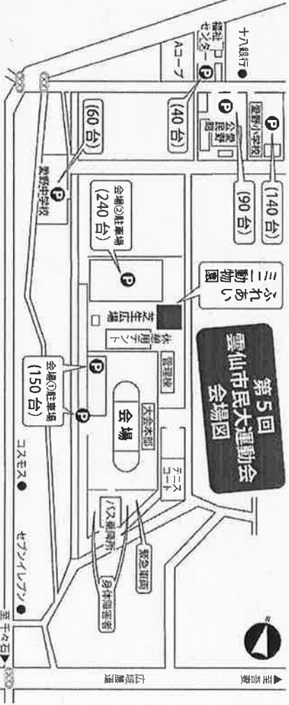
シャトルバス時刻表

主催：雲仙市民運動会実行委員会 ●お問合せ先：雲仙市民運動会実行委員会事務局（雲仙市教育委員会又ポーツ振興課） 〒854-0492 雲仙市千々石町戊 582 番地 TEL 0957-37-3113 FAX 0957-37-3112