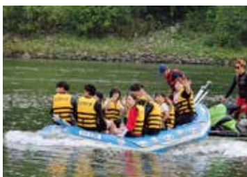
ラフティング体験

韓国語や英語をともに話すことができなかった私は、交流が上手くいくか心配で、初めての面会の時、ともに韓国の中学生の顔を見ることができませんでした。しかし、みんなの優しさが私を助けてくれました。ラフティング体験の時は、みんなで声を合わせてこいだり、水をかけあつたり、楽しむことができました。韓国の友達ができ、これからはもう少し広い視野をもって、色々なことを見たり聞いたりできるようにしたいと思います。また来年も、このような機会があれば、ぜひ参加して、もっとコミュニケーションがとれるようにしたいと思います。