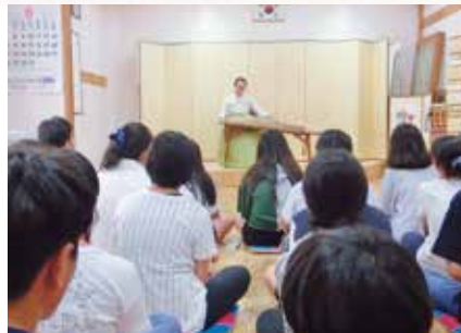
東便制パンソリ体験

キムチなど辛い料理を食べている時に韓国に来たんだなと実感しました。約一週間ぶりに会ったけど緊張することなく普通に話すことができ、お寺の見学と一緒にしたり、押し花の作品を見たりして楽しかったです。パンソリ体験では、カヤグムなどの演奏を聴いたりできてとてもきれいな音色ですごかったです。