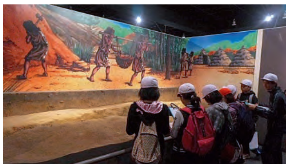
「大野原遺跡展示館・縄文の里」を見学する小学生。

※「大野原遺跡展示館・縄文の里」の開館時間は9～17時で入館無料。毎週火曜日および年末年始は休館。見学時は施設職員にお声がけください。