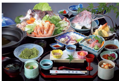
写真は3,600円コースです。

お一人様 4,600円 (税込) コース 要予約: 5名様以上 (各コース特典) ●お酒1本又は ジュース1本付き ●温泉入浴サービス (タオル付) 3,600円 (税込) コース