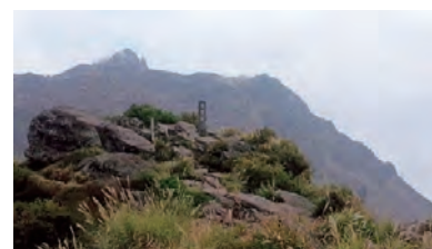
普賢岳から見る平成新山