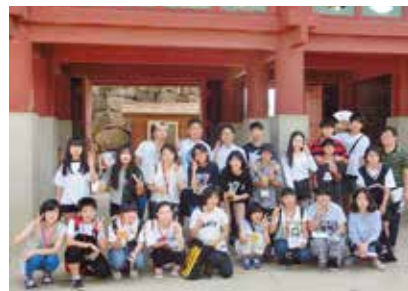
樂安邑城民族村見学

ていて、そこだけ時間の流れが止まっているようでした。外国の地というのは新鮮で目に写る一秒一秒の風景が宝物になりました。本当に貴重な体験ができ、この経験はこれからの私の糧となると思います。