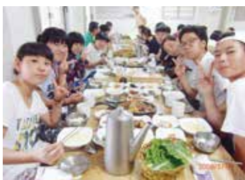
求礼郡中学生との食事風景