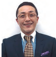
講師：スマイリーキクチ氏 (タレント)

※一時託児申込の場合は11月30日(木)までに窓口または お電話でお申込みください。