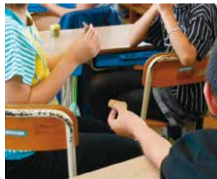
土器に触れているところ