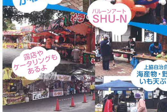
露店やケータリングもあるよ