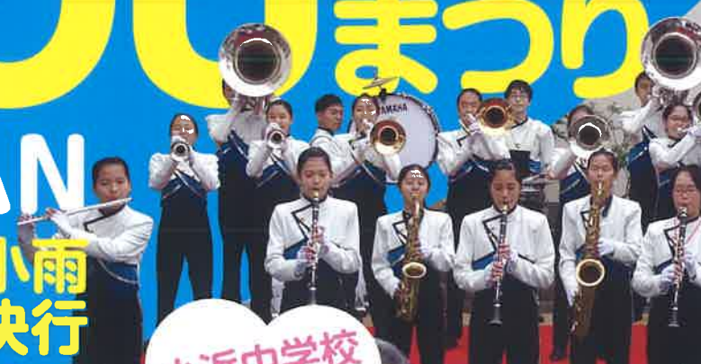
小浜中学校吹奏楽部