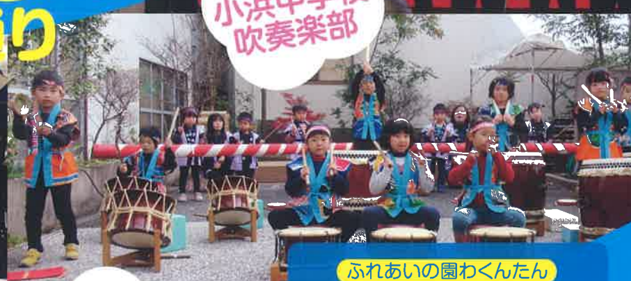
北串保育園 わらべ太鼓