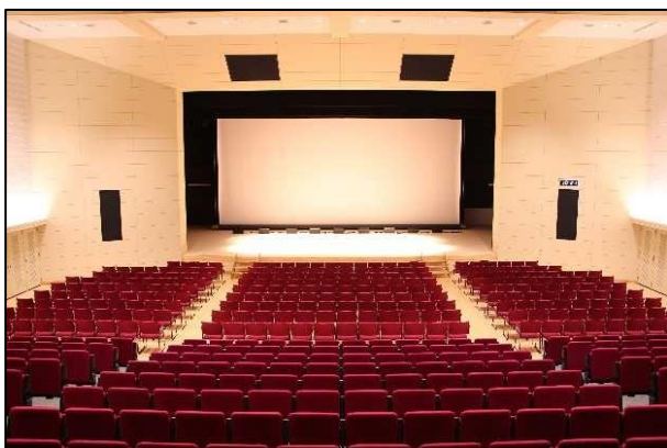
▼ステージ（大ホール）