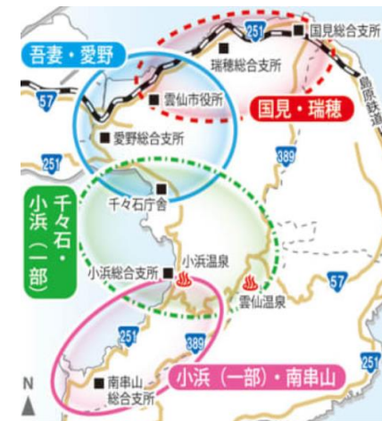
【画像】長崎新聞より引用