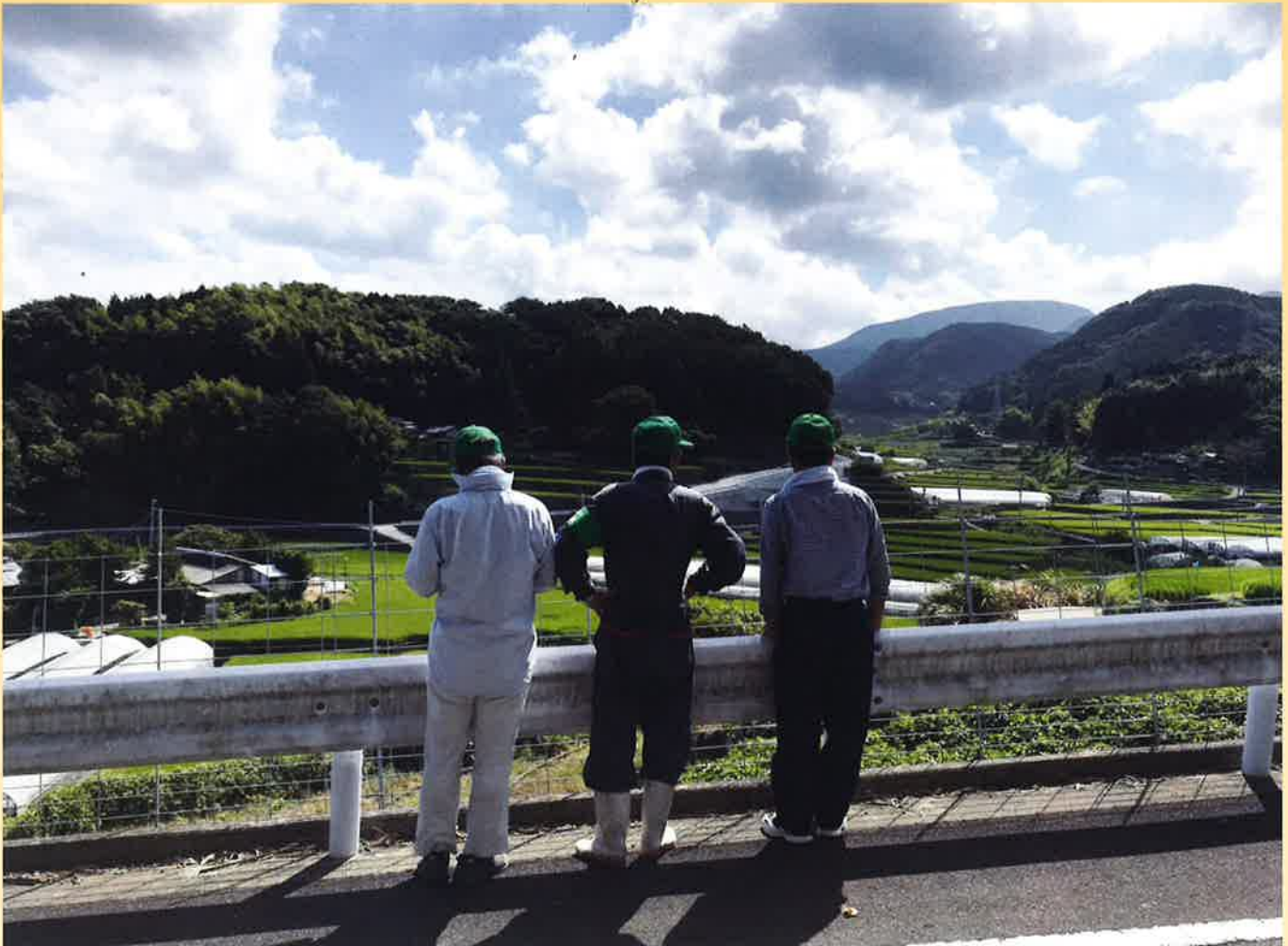
写真:農地パトロール(利用状況調査)の様子