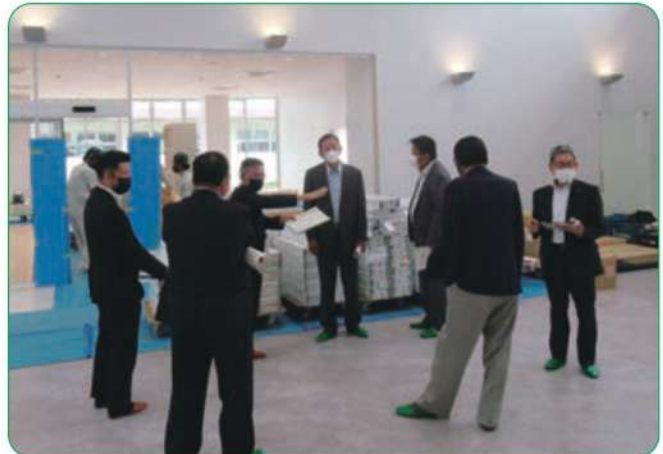
(仮称)新瑞穂総合支所新築工事