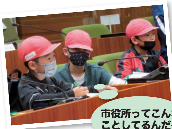
市役所ってこんなことしてるんだ～