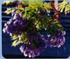
ジャカランダの花

ジャカランダが小浜温泉に植えられたのは昭和40年代、エチオピア暮らしの男性の「島原半島全体にジャカランダの花を咲かせて!」との願いから始まりました。