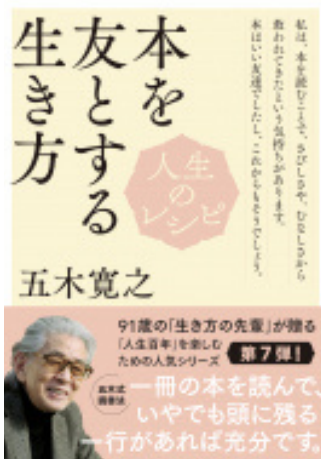
人生のレシピ 本を友とする生き方 五木寛之/著 (NHK出版)

91歳の著者。「生き方」の大先輩だ。本は努力や義務で読むのではなく、よき友であり面白いから読む、という。本書は好奇心の趣くまに、「ごった煮読書」を続ける著者のレシピのように感じる。