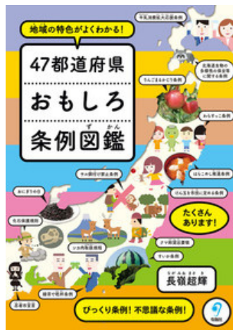
地域の特徴がよくわかる! 47都道府県おもしろ 条例図鑑 長嶺 超輝/著 (旬報社)

91歳の著者。「生き方」の大先輩だ。本は努力や義務で読むのではなく、よき友であり面白いから読む、という。本書は好奇心の趣くまに、「ごった煮読書」を続ける著者のレシピのように感じる。