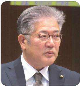
はやし だてつ ゆき 議員 林田 哲幸