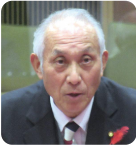
ふじもと じゅんじろう 議員 藤本 淳次郎