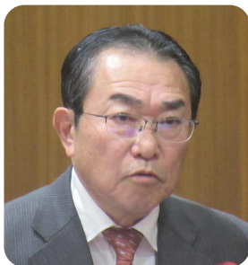
さかもと ひろき 坂本 弘樹 議員