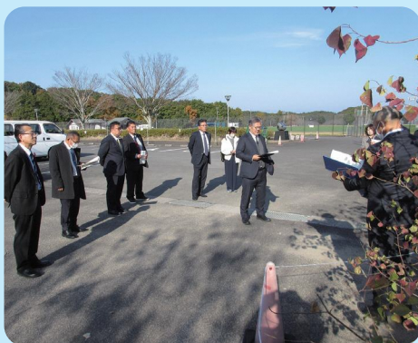
現地視察（国見総合運動公園）