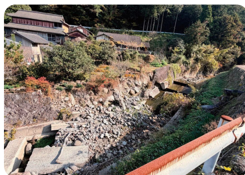
準用河川土黒川河川災害復旧工事(国見町)