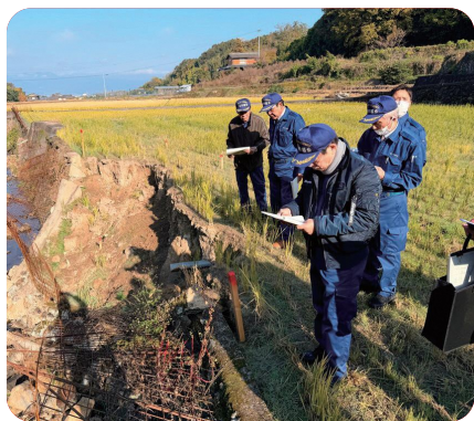
現地視察（普通河川田川原川河川災害復旧工事：吾妻町）