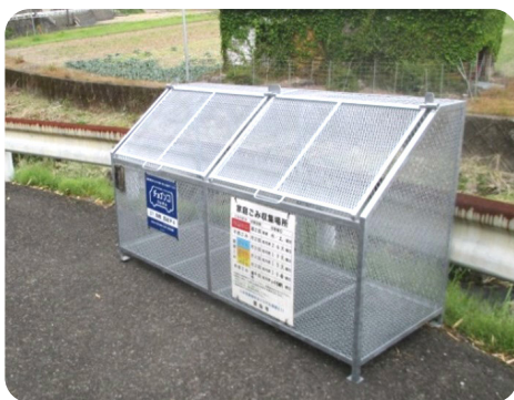
ごみステーション

部長 ごみステーションに持って行くことが困難な高齢者、障がい者等の世帯に対して、自宅まで行き、戸別に収集し、併せて、声掛け等の安全確認を行う支援制度である。要介護認定を受けている65歳以上の高齢者のみで構成される世帯および障害者手帳等の交付を受けている方のみで構成される世帯を支援している。