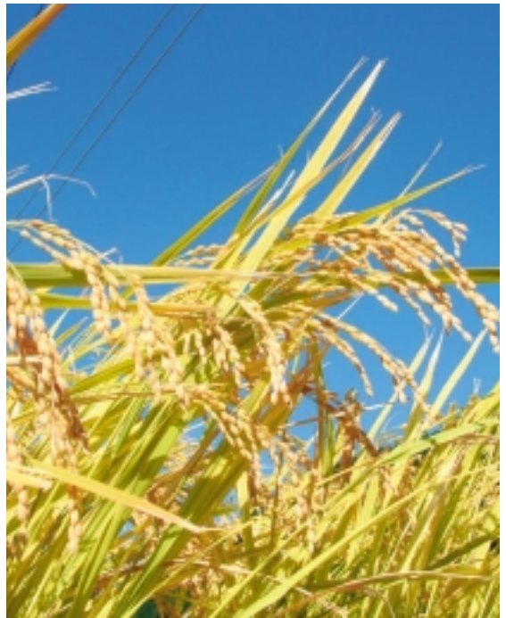
※写真は、イメージです。実際の商品とは異なります。

このにこまる(平成23年産新米 3kg入り)を、ハガキをいただいた人の中から抽選で、4人にプレゼントします。