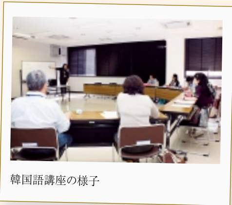
韓国語講座の様子

秋(ガウル)です。韓国の秋と日本の秋はすごく似ています。日本では「天高く馬肥ゆる秋」、韓国でも四字熟語で「天高馬肥(チョンゴマビ)」と、同じく比喻し、秋は涼しい気候と食べ物がすごくおいしい季節です。そして、紅葉を楽しむ季節でもあります。韓国では、「タンブンノリ」という言葉があり、日本と同じように紅葉狩りに行きます。「タンブン」は、紅葉、「ノリ」は、遊びの意味があります。