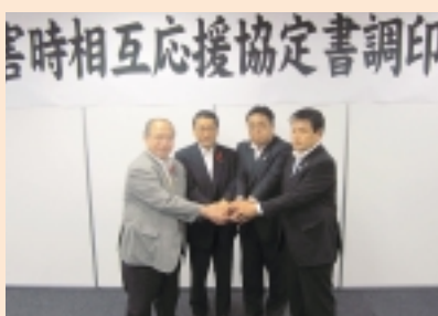
調印後、固い握手を交わす市長ら。(左から島原市、諫早市、雲仙市、南島原市)

これらの協定締結により、物資や資機材などをより迅速に供給できるものと期待されます。