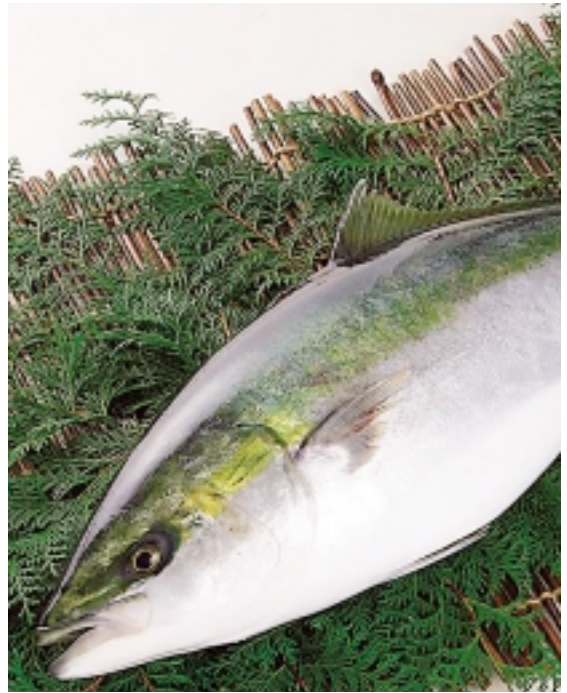
※写真は、イメージです。実際の商品とは異なります。