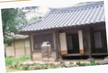
韓国伝統家屋の オンドル煙突