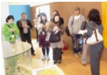
生命体験学校を視察

訪問した会員からは、「私たちが 受け入れる人々の懐の深さとおも てなしの心と姿勢は、とても素晴ら しかった。今後、食文化や芸術・芸能 文化交流 など、さ まざまな 交流を行 えたらと 思う。」な どの感想 がありま した。