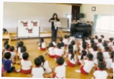
小さき花の幼稚園での国際理解講座

「チュウオ!(寒い)」。最近、朝、目が覚めると同時に 出る言葉です。ソウルよりは寒くないのですが、やっぱり 冬が寒いのはどこでも同じですね。しかし、その寒さを 暖かくする暖房は、日本と韓国では違います。